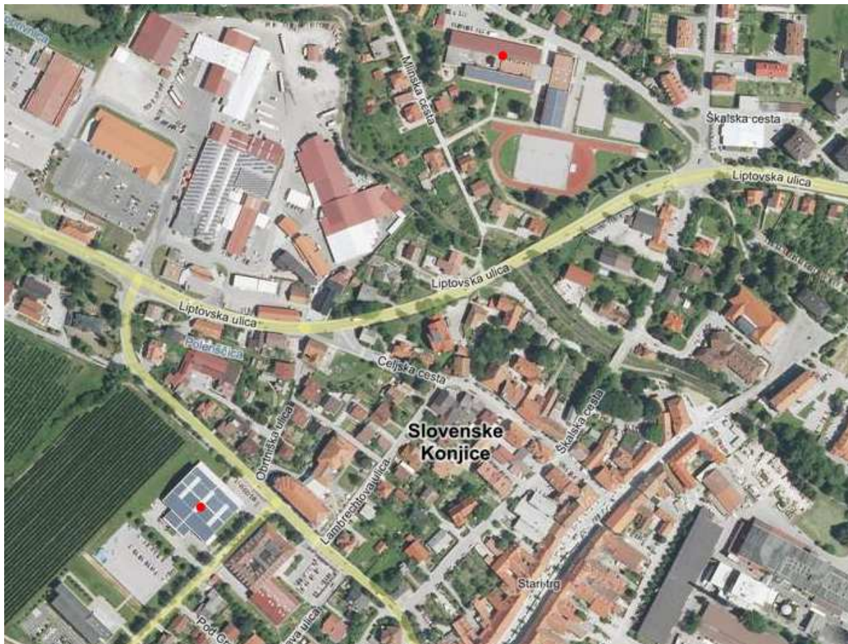
Slika 2: Lokacija občinskih namestitev (spodaj športna dvorana, zgoraj OŠ Ob Dravinji).