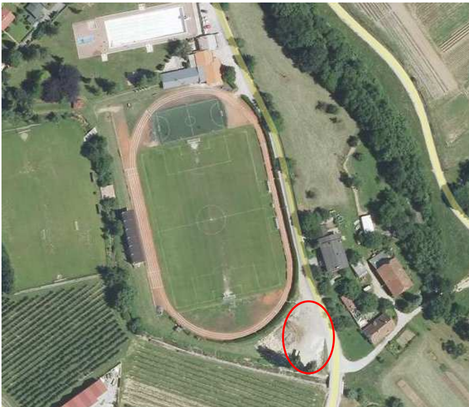
Slika 1: Lokacija občinskega sprejemališča Slovenske Konjice – Nogometni stadion